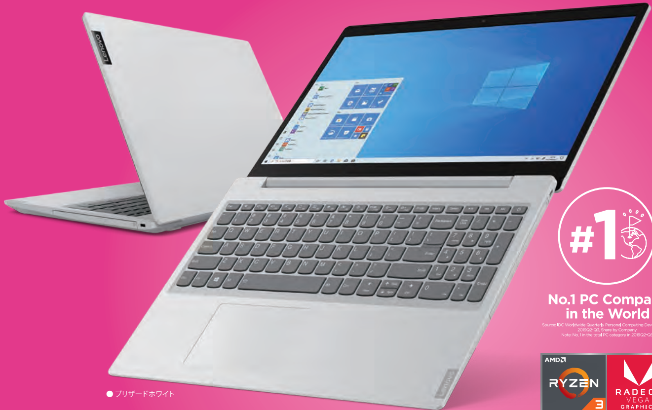
● プリザードホワイト