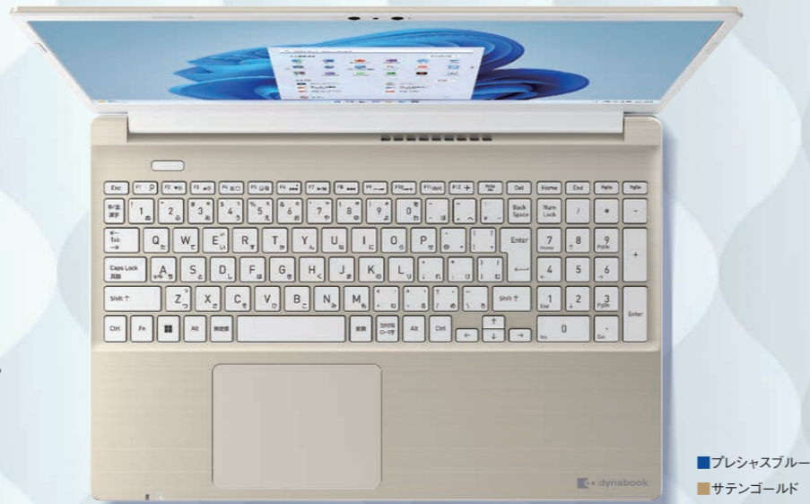
■プレシャスブルー ■サテンゴールド

第13世代 インテル® Core™ i5 プロセッサ搭載。 オンライン通話や動画視聴もスムーズ