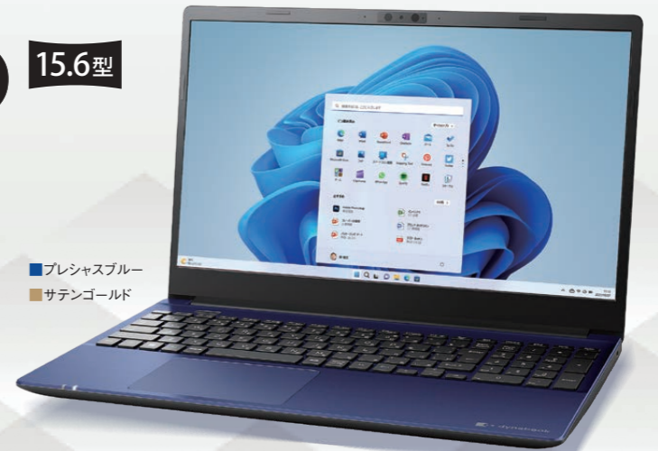
■プレシャスブルー ■サテンゴールド