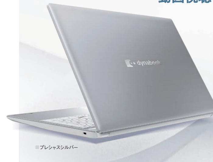
■プレシャスシルバー