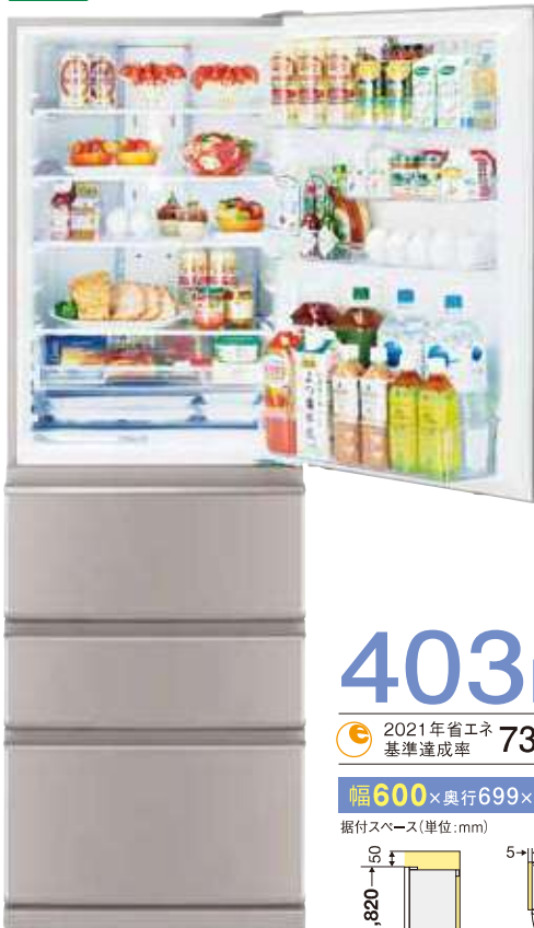
シャイングレージュ(C)