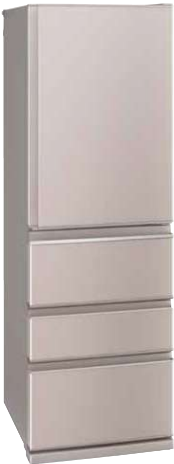
MR-N40E3J シャイングレージュ(C)