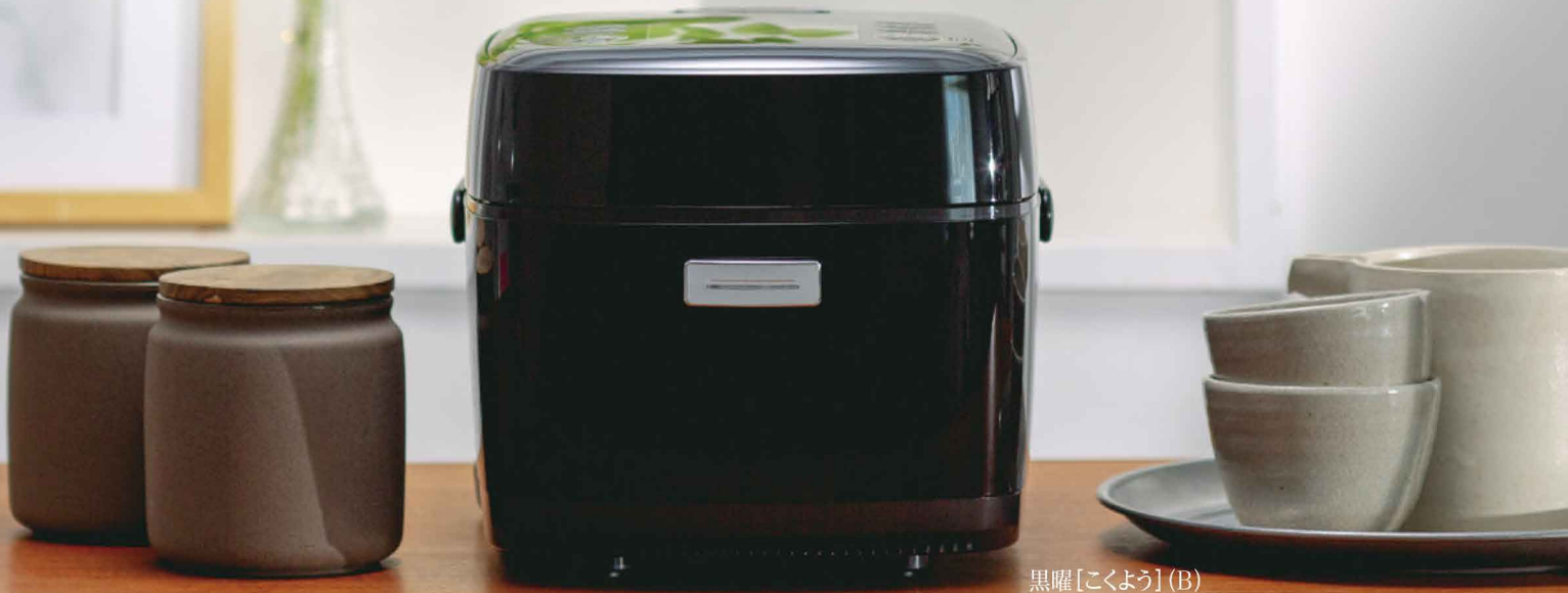
黒曜[こくよう](B) 天面色：本体同系色