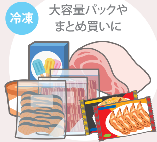
※温度調整ダイヤル「冷凍 強め」で約-18℃