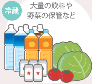
※温度調整ダイヤル「冷蔵2」で約4℃

冷凍庫としてだけでなく、冷蔵に切替して使用可能。生活シーンに合わせてお使いいただけます。