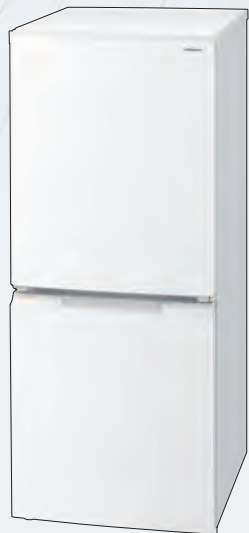
SJ-15E4-W(フレンチマットホワイト)