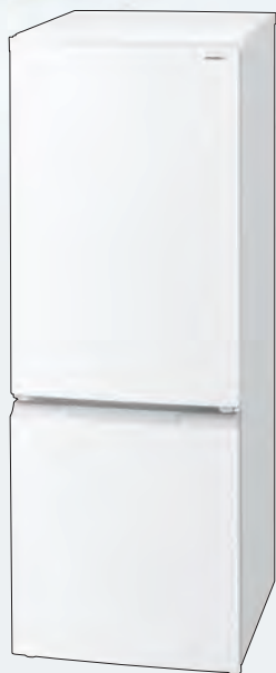
SJ-18E4-W(フレンチマットホワイト)