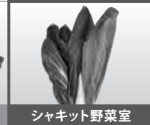
シャキッと野菜室