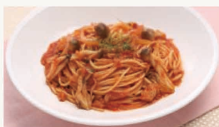
ツナのトマトソースパスタ