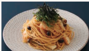
いかとたらこの和風パスタ

パスタ、具材、調味料、水を耐熱ガラス製ボウルに入れて、あとはおまかせ。大きな鍋でゆでる必要がなく、1~4人分のパスタを簡単に調理できます。